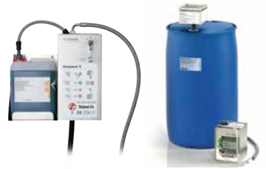
Pompes de dosage et installations d'alimentation