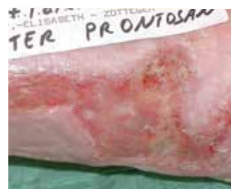
Après le nettoyage avec Prontosan®