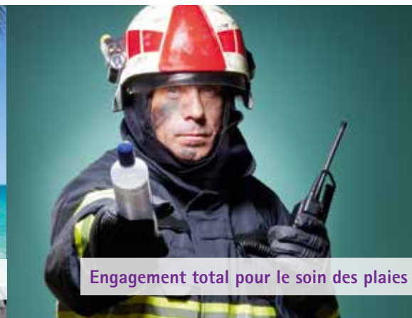
Engagement total pour le soin des plaies