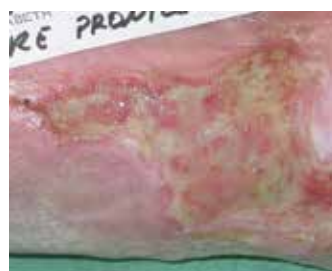
Avant le nettoyage