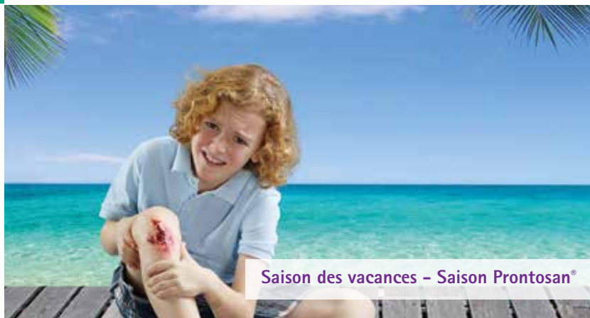
Saison des vacances – Saison Prontosan®